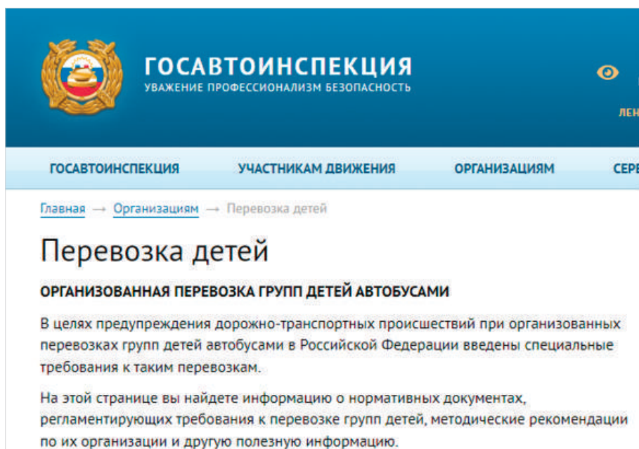
Рисунок 2. Сайт Госавтоинспекции для подачи уведомления

На данном сайте можно заполнить уведомление. Для подачи уведомления об организованной перевозке детей автобусами необходимо использовать специальный сервис данного сайта: https://гибдд.рф/transportation/applicant/ (рис. 3).