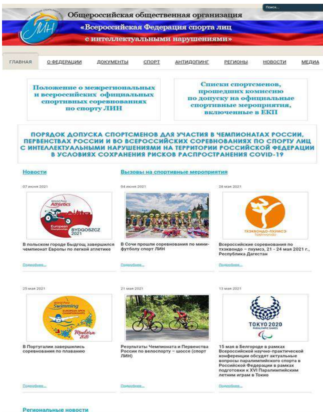
Рисунок № 4

Федерация спорта ЛИН ежегодно проводит семинары, с привлечением специалистов в области физической культуры и спорта, приглашает иностранных специалистов для обмена опытом в области развития спорта ЛИН, ежегодно выпускает сборники, в которых содержатся нормативные, правовые, программно-методические материалы и отображаются все актуальные проблемы спорта ЛИН, также регулярно публикуются статьи в журнале «Адаптивная физическая культура и спорт» о спорте ЛИН (рисунок