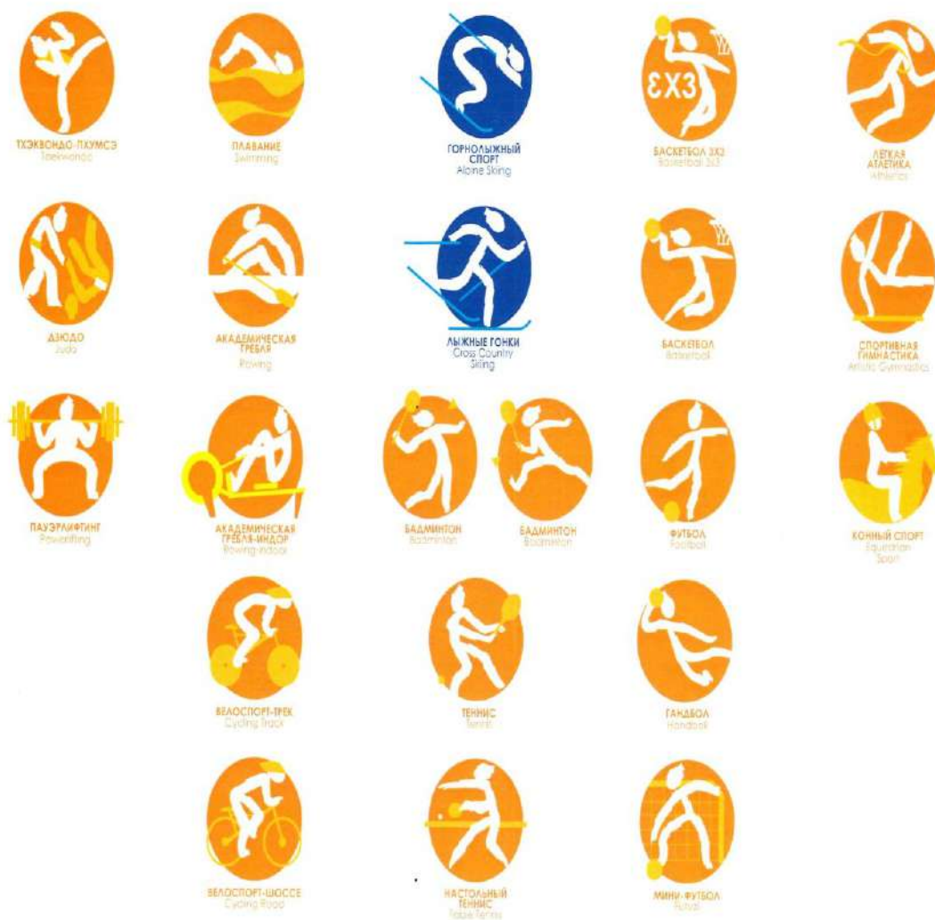
Рисунок № 3