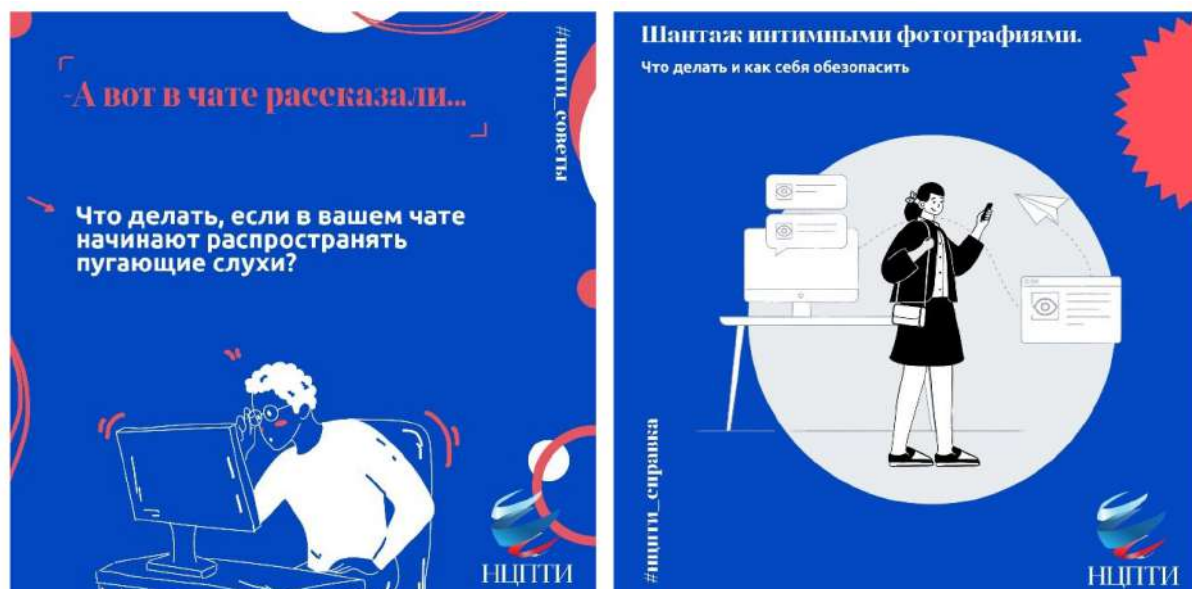
Рис. 13. Разъясняющие карточки НЦПТИ

НЦПТИ был создан в 2012 году на базе НИИ «Спецвузавтоматика» с целью оказания информационно-аналитического, методического и технологического сопровождения деятельности ФОИВ, ОИВ субъектов Российской Федерации и образовательных организаций по противодействию идеологии терроризма и иным радикальным проявлениям в образовательной сфере и молодежной среде. Несмотря на то что профильными являются указанные выше цели, на сайте есть образовательный контент, направленный на формирование базовых представлений об информационной гигиене (рис. 13). Кроме того, НЦПТИ проводит тематические профилактические мероприятия, например Киберквиз.