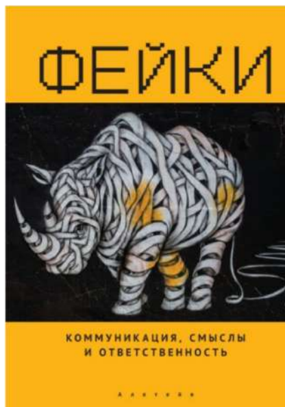
Рис. 12. Одна из первых в России монографий о фейках

Монография «Фейки: коммуникация, смыслы, ответственность» стала, пожалуй, первой в истории отечественной науки попыткой систематического осмысления проблемы появления фейков (рис. 12). Книга представляет собой результат кропотливой работы ученых из БФУ им. И. Канта. Она может быть полезна как для повышения собственной квалификации в сфере информационной гигиены, так и для использования ее материалов в образовательном процессе.