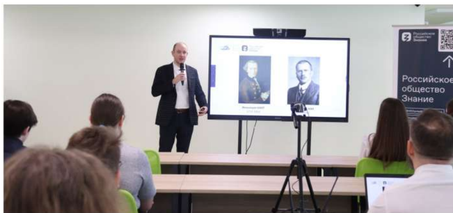
Рис. 9. Публичная просветительская лекция «Критическое мышление и информационная гигиена», организованная Российским обществом «Знание» 1 и проходившая на базе МАУ СОШ № 59 г. Калининграда с интернет-трансляцией для 11 школ Калининградской области (всего очно и дистанционно в мероприятии приняли участие 180 учащихся)

Особенности: как правило, подобный формат реализуется в свободное от образовательного процесса время. При этом открытая лекция может проходить как в стенах образовательного учреждения (рис. 9), так и любого учреждения культуры, молодежной политики или вообще на независимых площадках. Например, такие мероприятия востребованы библиотеками, молодежными клубами, муниципальными культурно-досуговыми центрами. Если нет возможности напрямую контактировать с данными организациями, то можно обратиться к их учредителям — региональным органам государственной власти и местного самоуправления. Помощь в организации подобных открытых лекций могут оказывать также некоммерческие организации, в частности Российское общество «Знание». Для реализации этого вида профилактических мероприятий одним из самых важных требований является качественно подготовленная презентация. Также в конце выступления обязательно необходимо оставлять время на вопросы из аудитории.