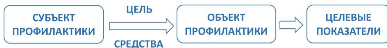
Рис. 3. Структура профилактической работы

Профилактическая работа, направленная на формирование умений и навыков информационной гигиены, должна начинаться с четкого понимания субъекта, объекта, целей, средств и результатов данной деятельности (рис. 3). Кроме того, следует представлять спектр угроз, которым призвана противостоять информационная гигиена и которые будут подробнее охарактеризованы ниже. Также важно помнить, что только жесткая привязка к практикам современной повседневности, касающимся каждого индивида, взаимодействующего с информационной средой, только указание конкретных примеров из жизни, связанных с нарушением законных прав и свобод гражданина, могут обеспечить подлинный интерес целевой аудитории проводимой работы.