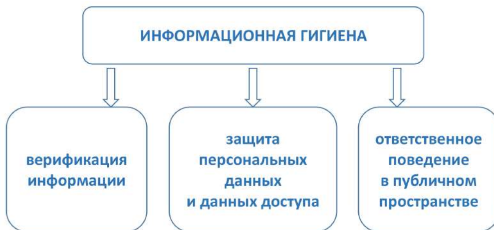
Рис. 2. Базовые умения и навыки информационной гигиены

В соответствии с указанными умениями будут варьироваться угрозы, против которых должны быть направлены навыки информационной гигиены.