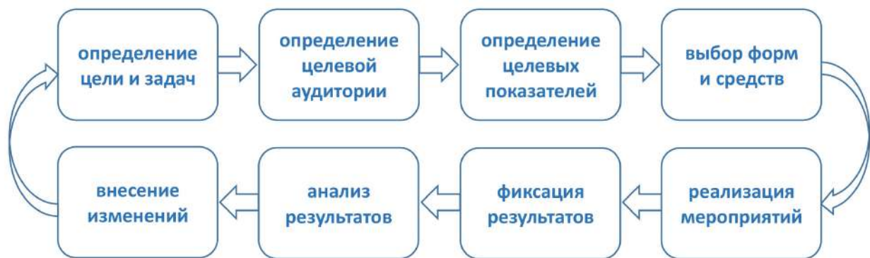
Рис. 5. Общий алгоритм профилактической деятельности