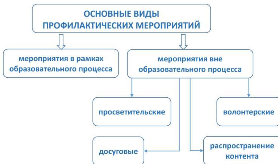
Рис. 6. Основные виды профилактических мероприятий

Следует отметить, что форм и видов профилактических мероприятий может быть множество, как и форм любой образовательной и воспитательной деятельности. Поэтому далее будут приведены лишь некоторые варианты. Основными видами при этом будут профилактические мероприятия в рамках учебного процесса и за его пределами, включая просветительскую деятельность, досуг, изготовление и распространение профилактического контента, волонтерство (рис. 6).