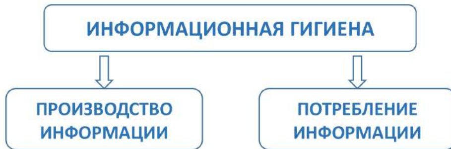
Рис. 1. Векторы применения информационной гигиены

Исходя из поставленной задачи, целесообразно дать следующее определение: информационная гигиена — это совокупность компетенций, позволяющих обеспечить безопасность взаимодействия индивида с информационной средой и направленных на формирование умений и навыков осознанного и ответственного потребления и производства (распространения) информации.