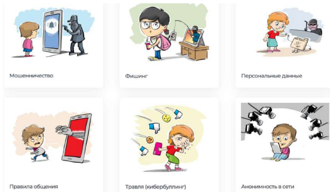
Рис. 10. Информационные памятки для детей и подростков с сайта Лиги безопасного Интернета