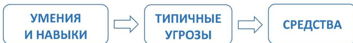
Рис. 4. Общий алгоритм выбора средств информационной гигиены

Выбор средств обеспечения информационной гигиены должен осуществляться сообразно базовой группе умений и навыков в зависимости от характера конкретных угроз (рис. 4).