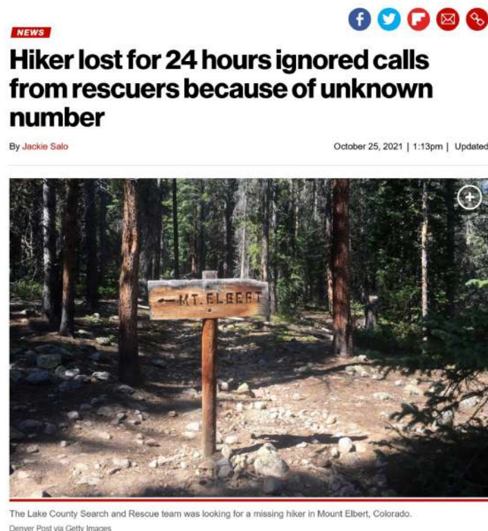
Рис. 7. Статья из газеты «Нью-Йорк Пост» о потерявшемся туристе, который не отвечал на звонки с незнакомых номеров

Одной из сложностей, которые могут возникнуть с проведением такого вида занятий, является возбуждение интереса аудитории, которая в рамках учебного процесса может ничего особенного не ждать от преподавателя, воспринимая урок как рутину. Здесь важно начать занятие с какого-то интересного случая или примера того, как знание или незнание основ информационной гигиены сказывается на жизни людей. Так, буквально недавно заблудившийся турист из Колорадо сутки не отвечал на звонки спасателей, так как они были с незнакомого номера 1 (рис. 7). К счастью, все обошлось, однако такая явно невротическая установка могла привести к трагедии. Все потому, что для человека, плохо владеющего навыками информационной гигиены, действительно любой незнакомый звонок становится проблемой и ввергает в состояние страха и растерянности, хотя в таких случаях важно не терять самообладание и помнить, что с незнакомого номера может звонить близкий человек, у которого сел или пропал телефон.