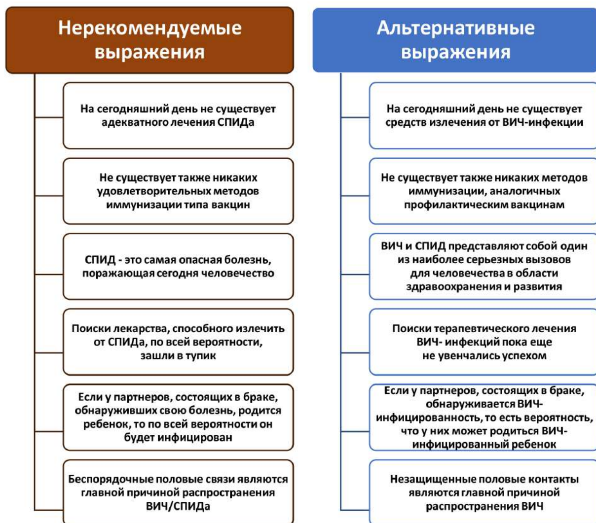
Рис. 3. Примеры nereкомендуемых выражений и их альтернативы

Мы приводим примеры nereкомендуемых выражений и их альтернативы (рис. 3).