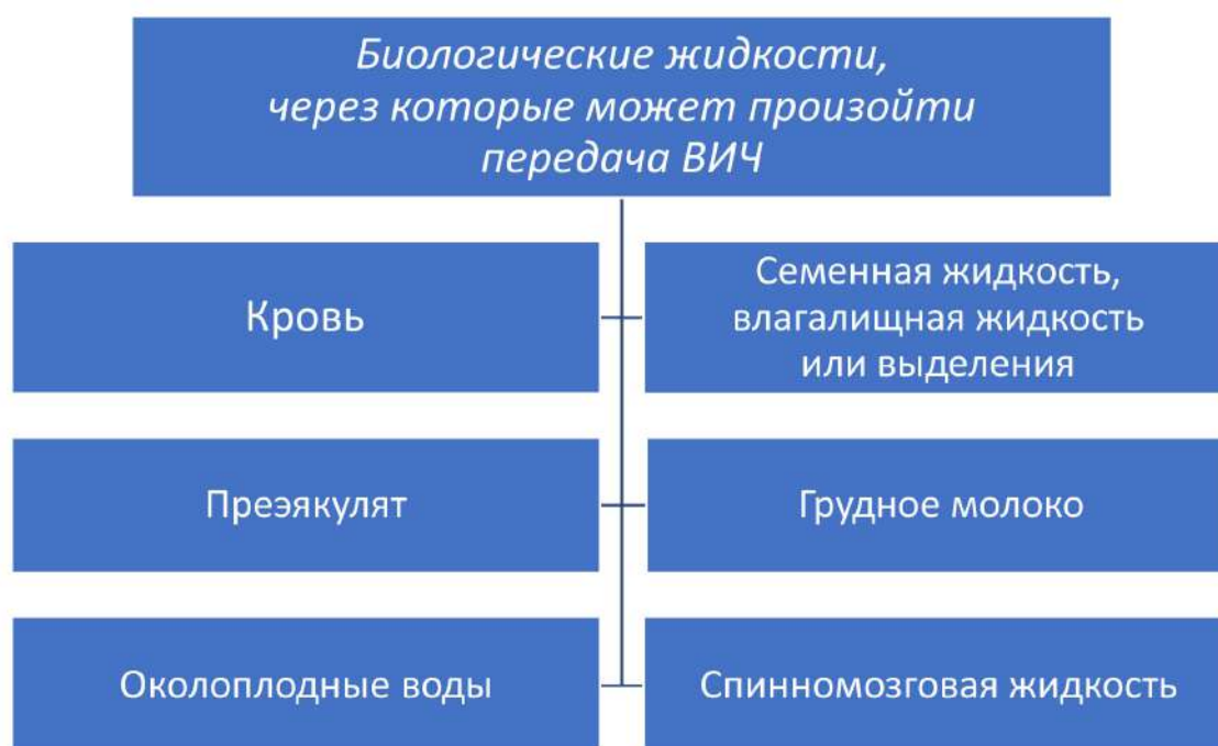
Рис. 1. Биологические жидкости, через которые может произойти передача ВИЧ

Неверное представление о биологических жидкостях, через которые может произойти инфицирование ВИЧ, является распространенной причиной страха и непонимания и способствует усилению дискриминации в отношении людей, живущих с ВИЧ (рис. 1). Под биологическими жидкостями организма подразумеваются все жидкости, выделяемые человеческим телом, а не только те, которые участвуют в передаче ВИЧ.